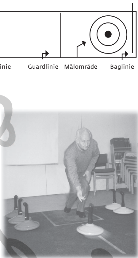
Stenen kastes ved at svinge armen blødt fra skulderleddet.....

Kastet er behageligt og ikke belastende for armen.